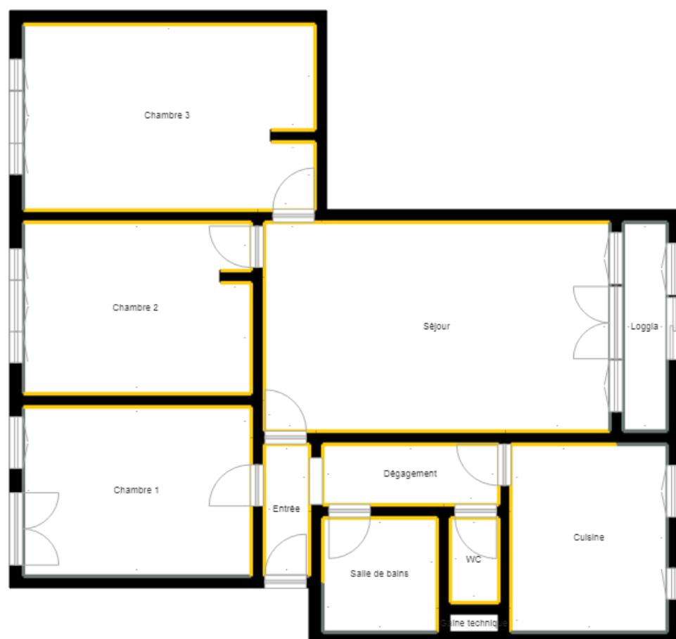
PLANCHE DE REPERAGE

Bien : 448LAJ0402 - 146 20 ALLEE DES CEDRES 77400 LAGNY SUR MARNE